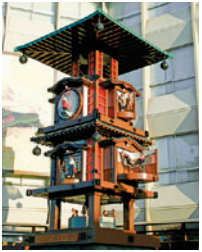
#붓짱 카라쿠리 시계탑

해질녘의 온천 거리는 많은 여행자들이 활기칩니다. 새로운 온천이 계속해서 흘러나오는 족욕탕(무료)에 발을 담그거나 인형이 춤추는 카라쿠리 시계도 관람이 가능합니다. (오전8시~오후10시 사이에 한 시간 마다. 토, 일요일, 휴일, 성수기는 30분마다)