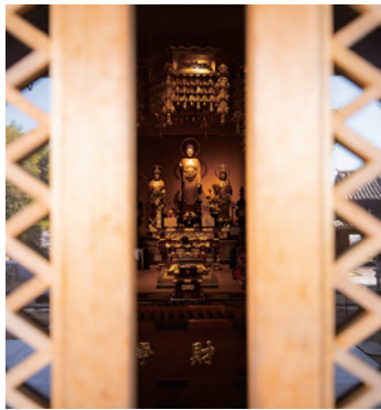
6 #호곤지 절