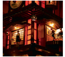
#bonjū 카라쿠리 시계탑

坊っちゃんカラクリ時計・足湯 밤에 조명이 켜지면 그 모습이 붉게 비추어져 화려합니다. 오후 10시까지 한시간 간격으로 인형들이 활기차게 춤추는 것을 볼 수 있습니다. (토·일요일, 휴일, 성수기는 30분마다)