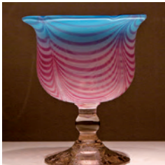
#도고 기야만 유리 미술관