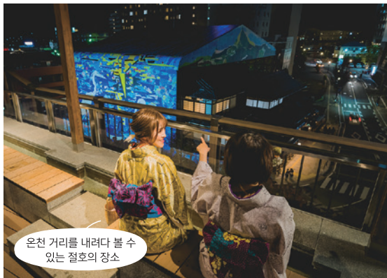
온천 거리를 내려다 볼 수 있는 절호의 장소