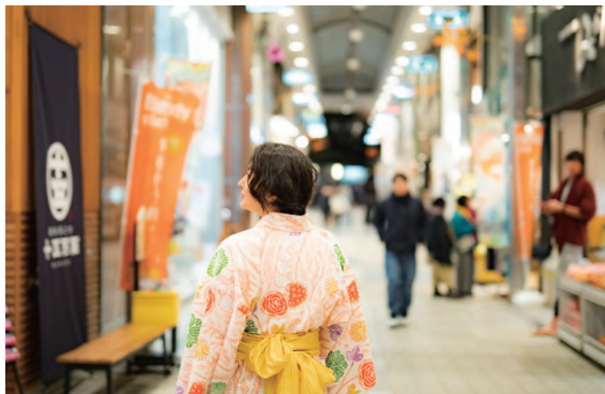
2 #도고상점가 세련된 가게에서 감성있는 분위기의 가게까지 준비합니다