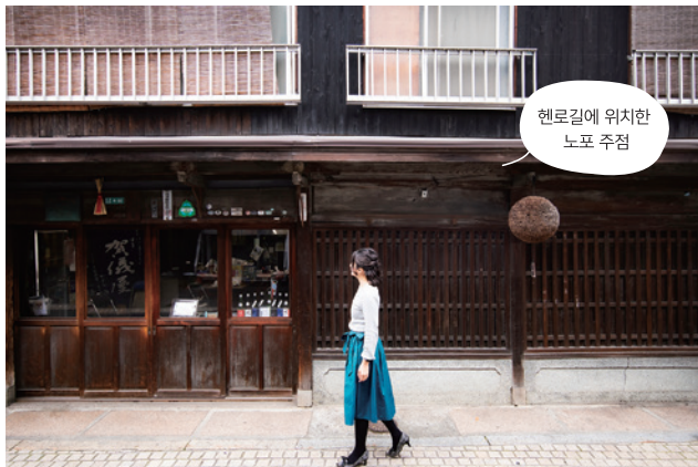
헨로길에 위치한 노포 주점