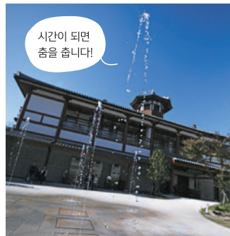
시간이 되면 춤을 춥니다!