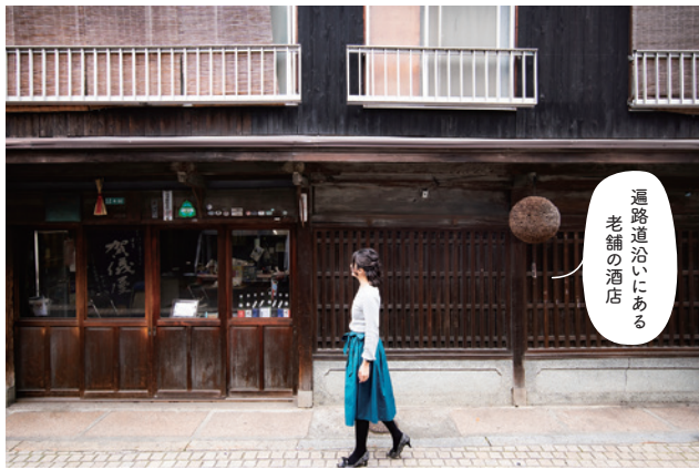
6 #酒屋(山澤商店) #遍路道