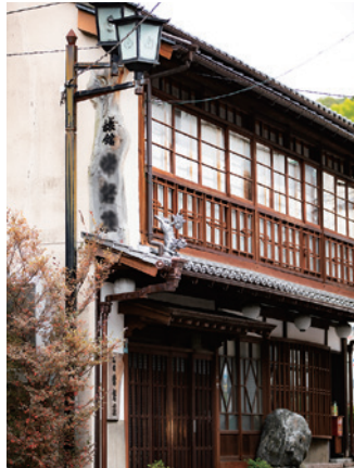
#旅館 #内湯(常磐荘) 「内湯」とは温泉街にある旅館の温泉風呂のこと。道後では昭和31年(1956年)に内湯がひかれた