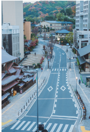
3 #白鷺坂 周辺には温泉旅館やホテルが立ち並び