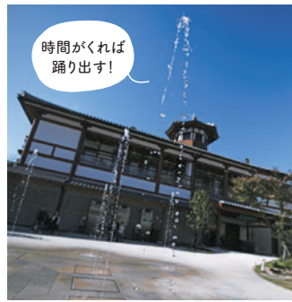
3 #飛鳥乃湯泉 中庭で見られる噴水のショー