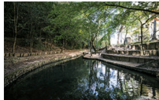
7 #第5分湯場 周辺は静かなたずまい