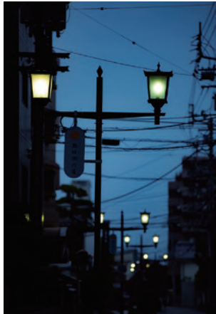
2 #にきたつの道 美容室や八百屋があり、生活感のある夜は郷愁を誘う