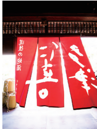
#水口酒造 日本酒や地ビールを製造する老舗の蔵元