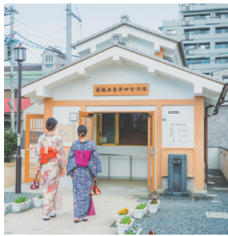
1 #第4分湯場 源泉井戸から温泉を集める様子が見られる