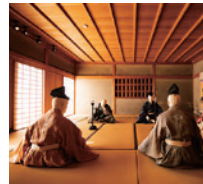
#湯築城跡 #武家屋敷

中世の伊予(愛媛)を治めた河野氏の城跡。道後は中世伊予の中心であった。武家屋敷などが復元されている。武家屋敷や資料館はAM9:00~PM5:00。月曜休館(祝日の場合は翌平日)。